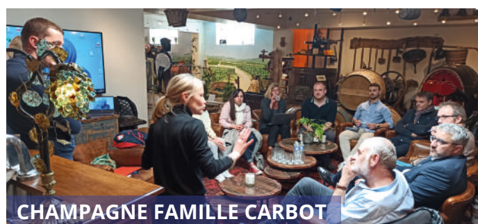
CHAMPAGNE FAMILLE CARBOT