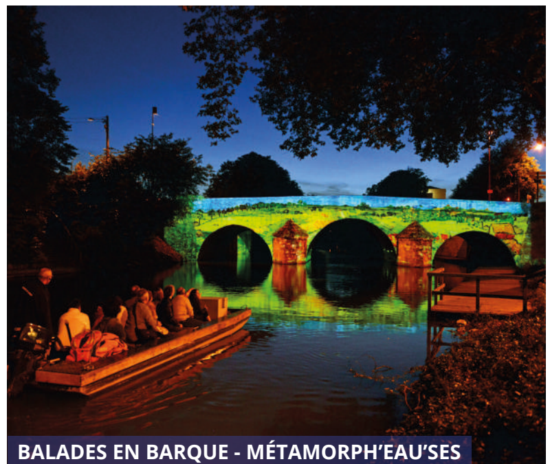
BALADES EN BARQUE - MÉTAMORPH'EAU'SES