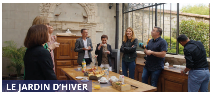
LE JARDIN D'HIVER