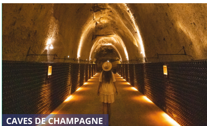
CAVES DE CHAMPAGNE