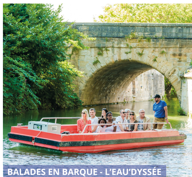
BALADES EN BARQUE - L'EAU'DYSSÉE