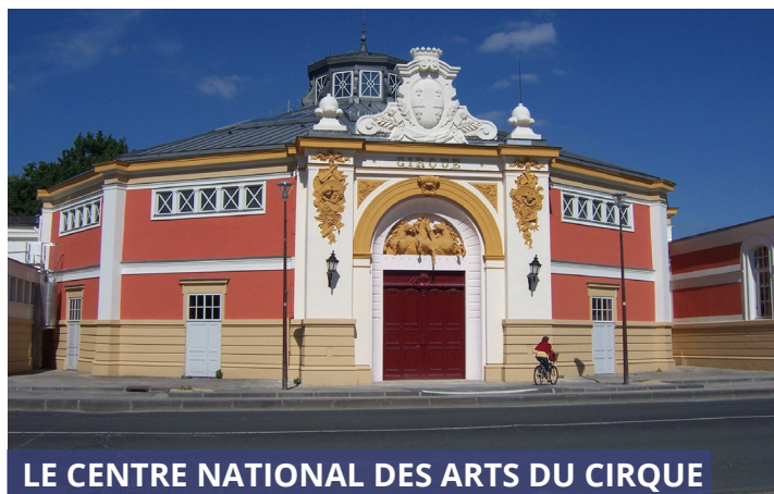
LE CENTRE NATIONAL DES ARTS DU CIRQUE