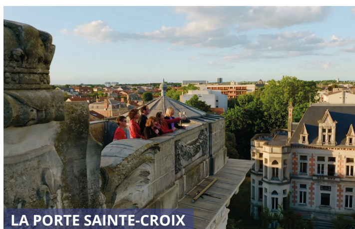
LA PORTE SAINTE-CROIX