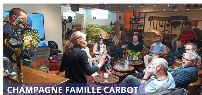
CHAMPAGNE FAMILLE CARBOT