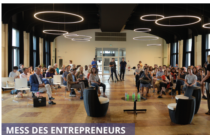
MESS DES ENTREPRENEURS