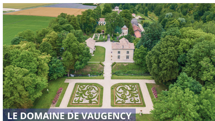
LE DOMAINE DE VAUGENCY