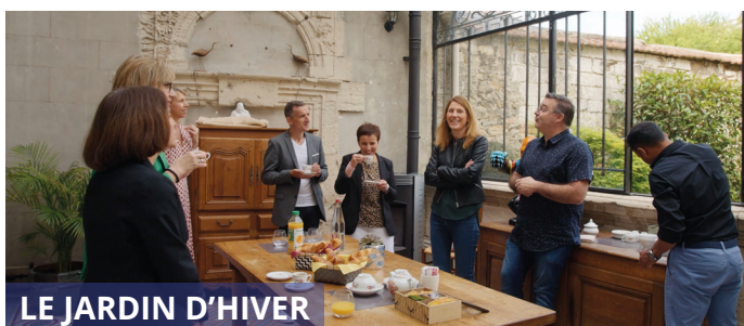
LE JARDIN D'HIVER