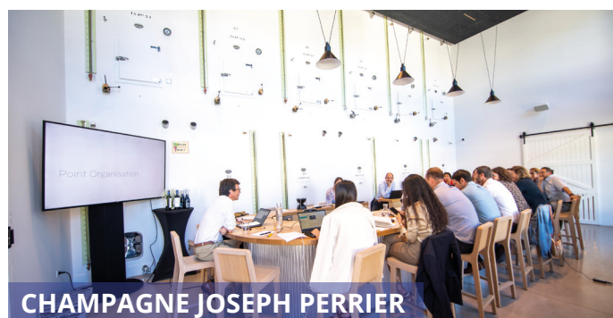
CHAMPAGNE JOSEPH PERRIER