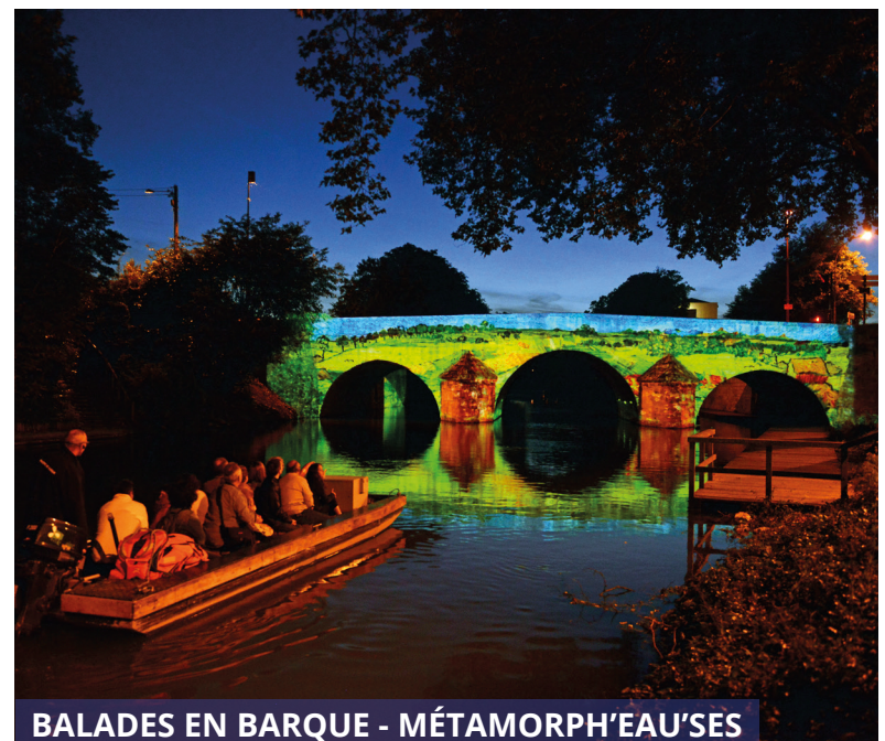
BALADES EN BARQUE - MÉTAMORPH'EAU'SES