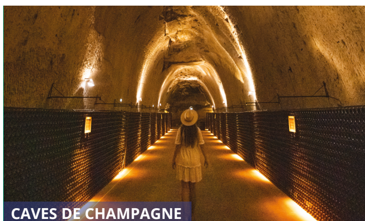
CAVES DE CHAMPAGNE