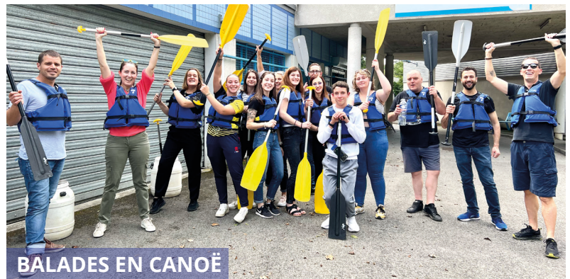
BALADES EN CANOË