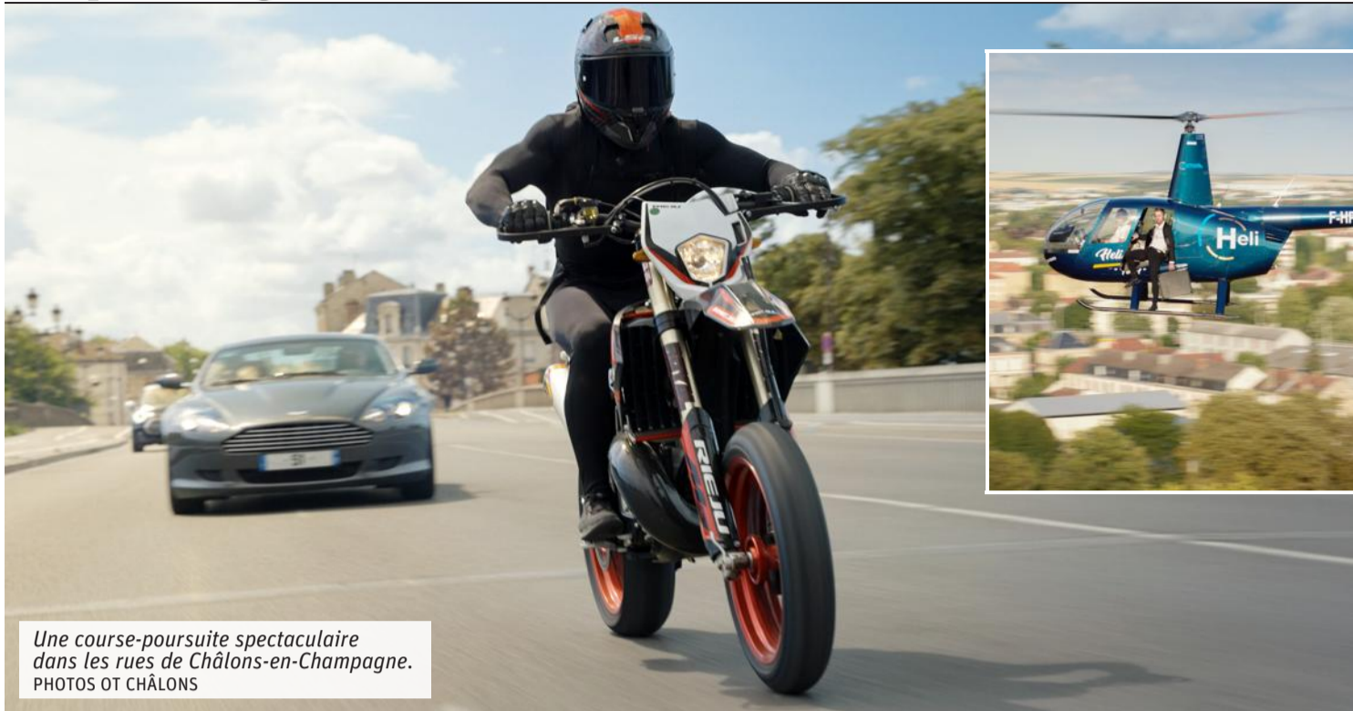
Une course-poursuite spectaculaire dans les rues de Châlons-en-Champagne.